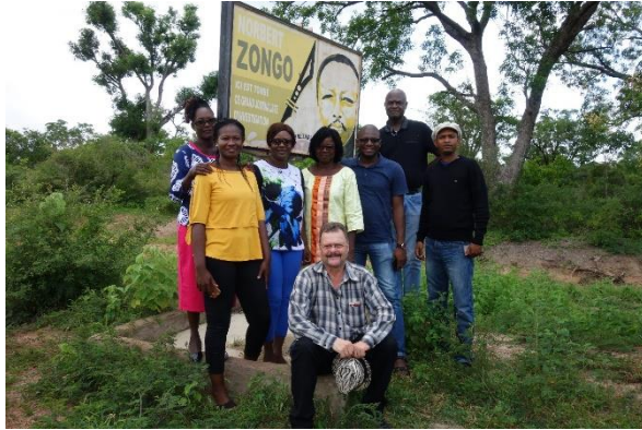
Le LACET, c'est aussi l'engagement. Ici la stèle dédiée au journaliste Norbert Zongo sur le lieu de son assassinat.