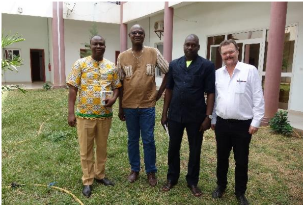
La Coordination du LACET à l'ISH de Bamako.