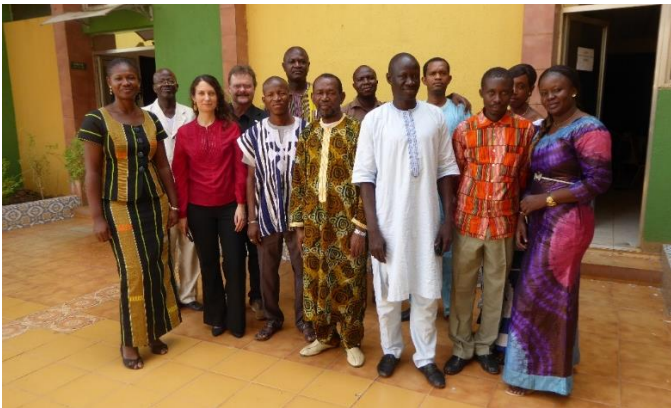
L'atelier international « Transition politique et gouvernance communale en Afrique de l'Ouest » à Ouagadougou en avril 2017 fut un moment décisif pour la création du LACET.